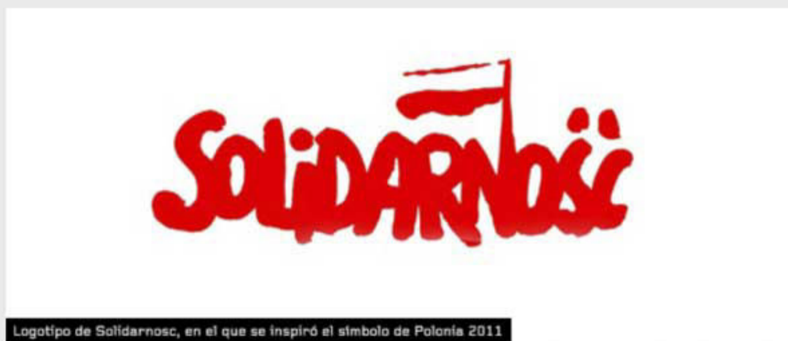
Logotipo de Solidarnosc, en el que se inspiró el símbolo de Polonia 2011

El logotipo que representa a Polonia es obra de Jerzy Janiszewski, artista gráfico y escenógrafo de fama mundial. Entre los muchos méritos de este autor se encuentra el haber ideado, hace 31 años, el logotipo "Solidarnosc" (Solidaridad), que dió la vuelta al mundo y se erigió como símbolo de la lucha polaca por la libertad y las reformas democráticas.